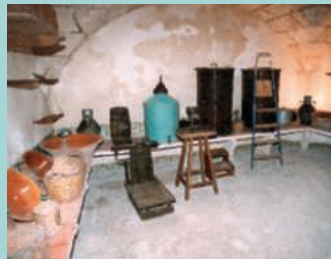
8 Dans la deuxième chambre, se trouvent les jarres à huile et d'autres ustensiles de l'époque.