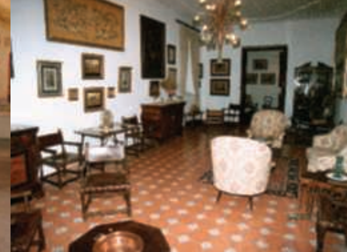
9 Salon: Pièce où les religieuses reçoivent encore aujourd'hui des visites.