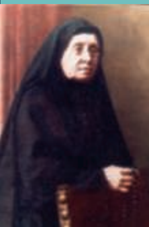
Les murs de « Can Clapés » sont devenus étroits. La graine semée par Mère Alberta a donné ses fruits. Aujourd'hui il y a beaucoup de religieuses qui, prenant l'exemple sur la Mère, veulent étendre par le monde le Royaume du Christ.