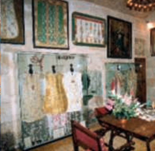
13 Salle d'exposition de chasubles.